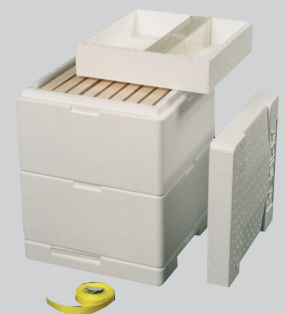
APIDEA Jungvolkkasten, CH-Mass